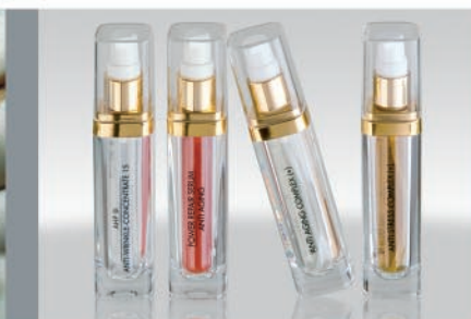
SOLUTION. Kosmetisch-medizinische Hightech-Seren zum Einschleusen.