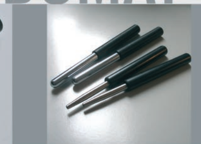
Myolift Gesichts- und Körperelektroden