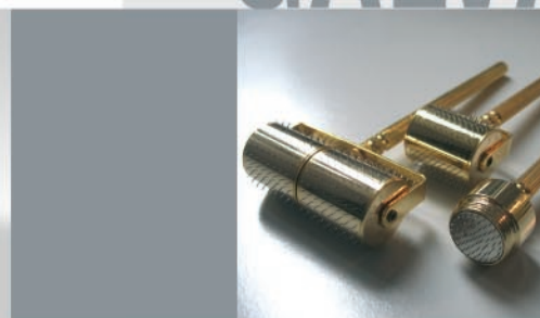
Anti Aging Mesoroller für Körper und Gesicht